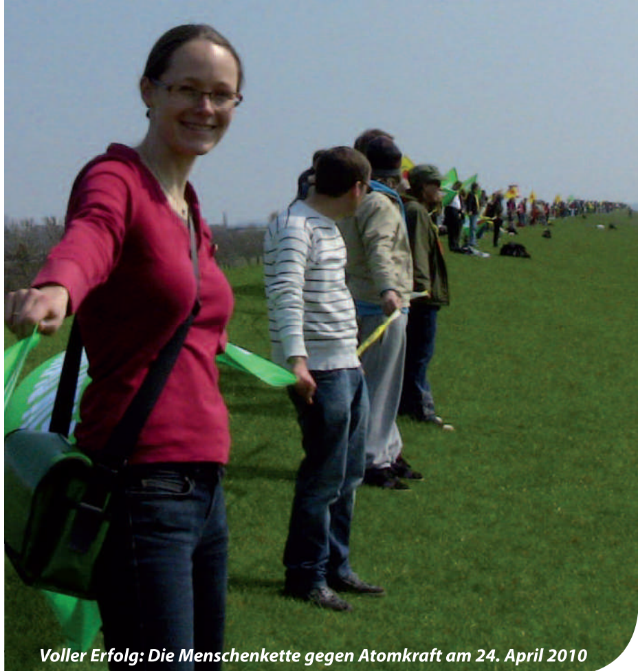
Voller Erfolg: Die Menschenkette gegen Atomkraft am 24. April 2010

Mit dem jetzt vorliegenden Entwurf eines Energieeffizienzgesetzes lässt die Regierung ihr eigenes Klimaschutzgebäude in sich zusammenbrechen. Von zielführenden Maßnahmen ist in dem Entwurf keine Spur zu finden. Kernstück des Gesetzes ist, dass die Verbraucher einmal im Jahr auf ihrer Stromrechnung einen Hinweis auf eine Internetseite bekommen – auf der sich eine Liste von Anbietern von Energiedienstleistungen befindet. Das ist eine Schnitzeljagd, aber kein Energieeffizienzgesetz.